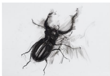
NATURALEZA PERTURBADA. ÁNGELES DÍAZ BARBADO

Del 10 de octubre de 2023 al 3 de marzo de 2024